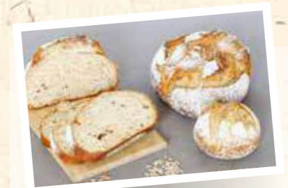
Urgetreide 6-Korn-Brot 30–50%

Pistor Art.-Nr. 18357 Margo Art.-Nr. 8300 | 25 kg Geschmacksprofil Grundrezeptur Nussig, mit feiner, lieblicher Sauerteignote Enthaltene Urgetreide UrDinkel (zertifiziert)