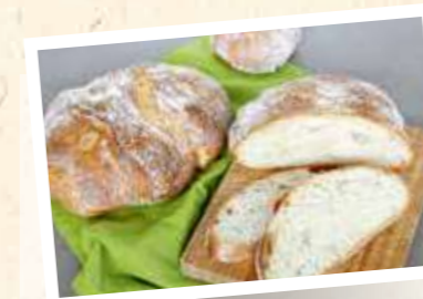
CreaFarine UrDinkel 20%

Pistor Art.-Nr. 18879 Margo Art.-Nr. 8295 | 25 kg Geschmacksprofil Grundrezeptur Würzig, leicht herb-nussig Enthaltene Urgetreide Emmer, Einkorn, Dinkel