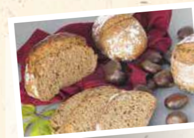
Combicorn UrAcker Korn 30%

Pistor Art.-Nr. 18465 Margo Art.-Nr. 2182 | 25 kg Geschmacksprofil Grundrezeptur Röstig, breites Säurespiel, würzig, einzigartig Enthaltene Urgetreide Einkorn, Emmer, Urroggen, Khorasan, Fisser Imperial Gerste, Dinkel