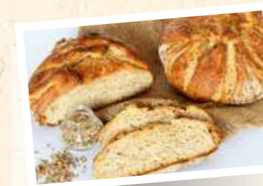
UrRoggen Naturale 10–30%

Pistor Art.-Nr. 3779 Margo Art.-Nr. 8101 | 25 kg Geschmacksprofil Grundrezeptur Rustikal, knusprig, röstig, malzig und erdig Enthaltene Urgetreide Einkorn, Emmer, Dinkel