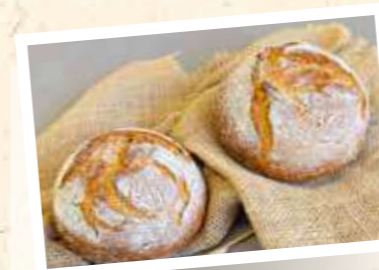
CreaFarine Emmer-Einkorn 60%

Pistor Art.-Nr. 18825 Margo Art.-Nr. 89369 | 25 kg Geschmacksprofil Grundrezeptur Intensiv nussig-röstig, mit malzig-süsslichem Abgang Enthaltene Getreide Dinkel