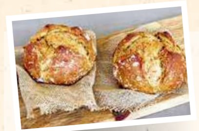
Dinkelbrötchen Mix 100%

Pistor Art.-Nr. 18825 Margo Art.-Nr. 89369 | 25 kg Geschmacksprofil Grundrezeptur Intensiv nussig-röstig, mit malzig-süsslichem Abgang Enthaltene Getreide Dinkel