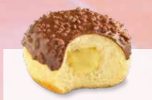
BOULE DE BERLIN CHOCOLAT À LA CRÈME VANILLE N° Margo 1282