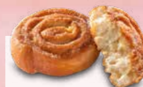
ESCARGOT AUX POMMES SUCRÉ N° Margo 277