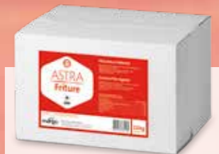
PLT ASTRA FRITURE N° Pistor 12738