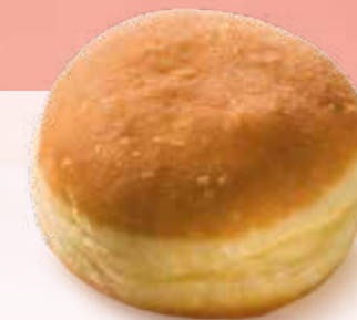
BOULE DE BERLIN, NON FOURRÉE N° Margo 79