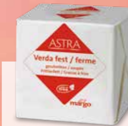
ASTRA VERDA FERME COUPÉE N° Pistor 4769