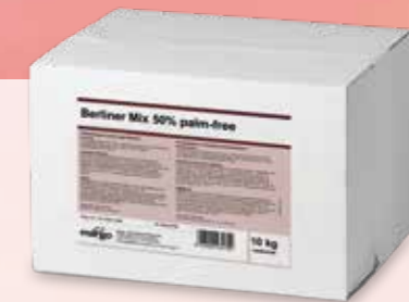
MIX BOULE DE BERLIN 50 % PALM -FREE N° Pistor 18828