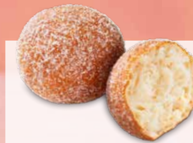
MINI BOULES AU SÉRÉ N° Margo 296