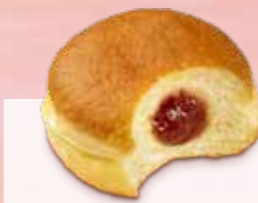
BOULE DE BERLIN, FOURRÉE N° Margo 1378