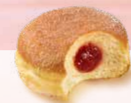
BOULE DE BERLIN, SUCRÉE & FOURRÉE N° Margo 1342